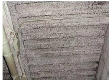
吹付け材※の例(床・天井)

※全ての吹付け材がアスベストを含む訳ではありません。判定には分析調査が必要です。