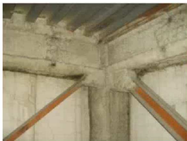
吹付け材※の例(梁・柱)